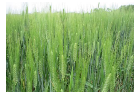
デュラム小麦「セトデュール」